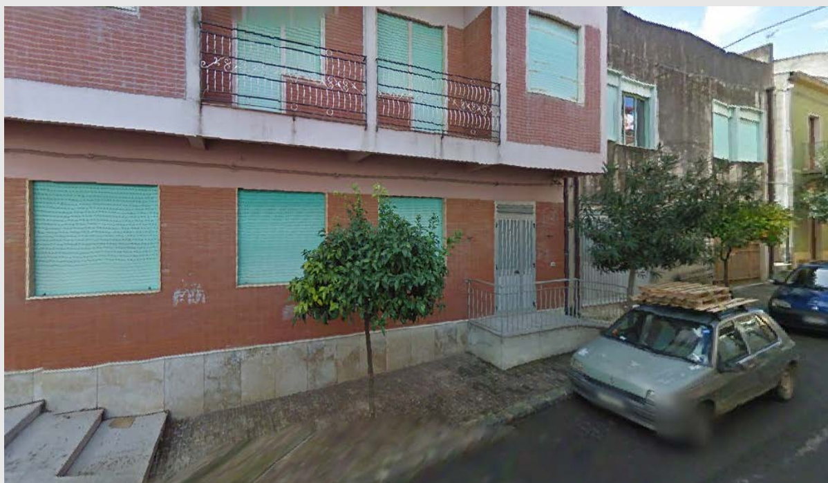
Plesso "INFANZIA MIRTO"

Misure di prevenzione e protezione proposte dal Servizio di Prevenzione e Protezione art. 33 D.Lgs. 81/08