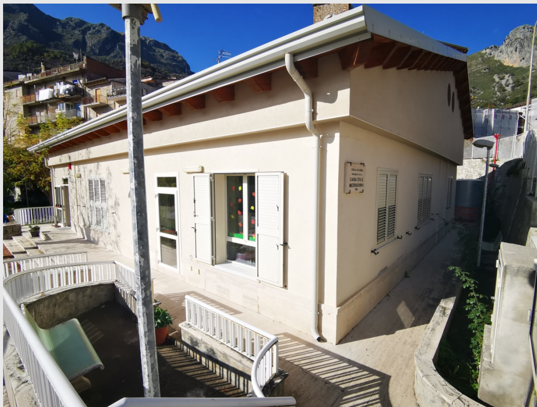
Plesso "INFANZIA LONGI"

Misure di prevenzione e protezione proposte dal Servizio di Prevenzione e Protezione art. 33 D.Lgs. 81/08